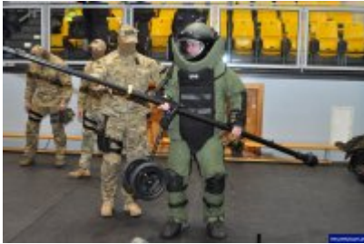
Konferencja "Policja bliżej nas"