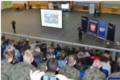
Konferencja "Policja bliżej nas"