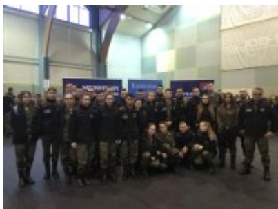
Konferencja "Policja bliżej nas"

Na zakończenie swoje umiejętności zaprezentowali policjanci z Nietatowego Zespołu Taktycznego Komendy Powiatowej Policji w Ostródzie wraz z funkcjonariuszami z Zespołu Minersko- Pirotechnicznego Samodzielnego Pododdziału Antyterrorystycznego Policji z Olsztyna. Zaprezentowane zostało dynamiczne zatrzymanie pojazdu, którym poruszał się sprawca przestępstwa. Taktyka policjantów polegała na zablokowaniu samochodu sprawcy i sprawnym obezwładnieniu i zatrzymaniu kierowcy. Następnie funkcjonariusze przystąpili do przeszukania pojazdu w trakcie którego w bagażniku znaleźli niebezpieczny pakunek. Na miejsce wezwani zostali funkcjonariusze z Zespołu Minersko- Pirotechnicznego SPAP Olsztyn, którzy zabezpieczyli i zneutralizowali ładunek wybuchowy. W trakcie konferencji nie zabrakło również pokazu tresury psów służbowych. Przewodnicy z Komendy Miejskiej Policji w Olsztynie oraz z Komisariatu Policji w Morągu zaprezentowali posłuszeństwo czworonożnych "funkcjonariuszy". Ogromne zaciekawienie wśród gości wzbudził również pokaz agresji psów oraz ich reakcji na komendy przewodnika podczas zatrzymywania niebezpiecznej osoby.