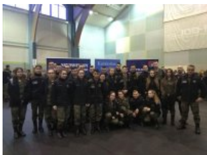
Konferencja "Policja bliżej nas"

Na zakończenie swoje umiejętności zaprezentowali policjanci z Nietatowego Zespołu Taktycznego Komendy Powiatowej Policji w Ostródzie wraz z funkcjonariuszami z Zespołu Minersko- Pirotechnicznego Samodzielnego Pododdziału Antyterrorystycznego Policji z Olsztyna. Zaprezentowane zostało dynamiczne zatrzymanie pojazdu, którym poruszał się sprawca przestępstwa. Taktyka policjantów polegała na zablokowaniu samochodu sprawcy i sprawnym obezwładnieniu i zatrzymaniu kierowcy. Następnie funkcjonariusze przystąpili do przeszukania pojazdu w trakcie którego w bagażniku znaleźli niebezpieczny pakunek. Na miejsce wezwani zostali funkcjonariusze z Zespołu Minersko- Pirotechnicznego SPAP Olsztyn, którzy zabezpieczyli i zneutralizowali ładunek wybuchowy. W trakcie konferencji nie zabrakło również pokazu tresury psów służbowych. Przewodnicy z Komendy Miejskiej Policji w Olsztynie oraz z Komisariatu Policji w Morągu zaprezentowali posłuszeństwo czworonożnych "funkcjonariuszy". Ogromne zaciekawienie wśród gości wzbudził również pokaz agresji psów oraz ich reakcji na komendy przewodnika podczas zatrzymywania niebezpiecznej osoby.