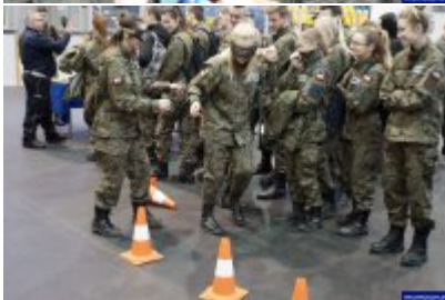
Konferencja "Policja bliżej nas"