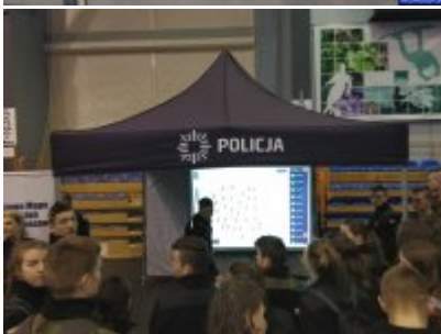
Konferencja "Policja bliżej nas"