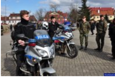
Konferencja "Policja bliżej nas"