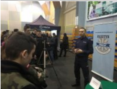
Konferencja "Policja bliżej nas"