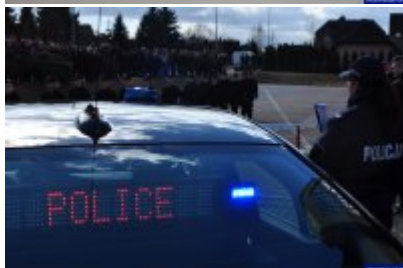
Konferencja "Policja bliżej nas"