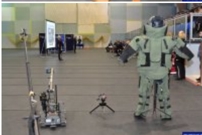
Konferencja "Policja bliżej nas"