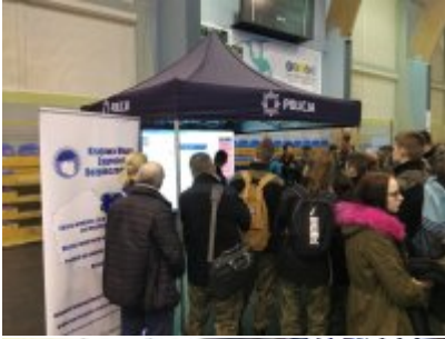
Konferencja "Policja bliżej nas"