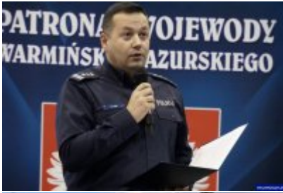
Konferencja "Policja bliżej nas"