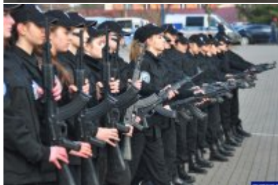
Konferencja "Policja bliżej nas"