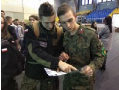
Konferencja "Policja bliżej nas"